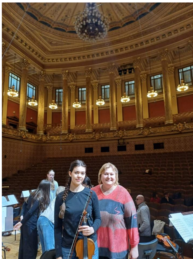
(foto - zkouška 18. 1. 2026 v Rudolfinu)