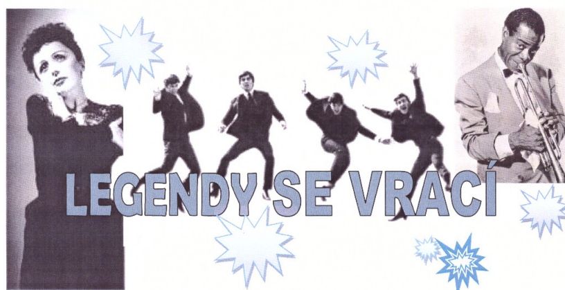
HUDEBNÍ TÁBOR 2017, Společnost přátel ZUŠ R. Firkušného Napajedla

Hudební tábor se konal 9. - 16. 7. 2017 jako vždy v Čeložnici u Kyjova, rekreačním středisku Relaxx. Hlavní téma tábora se objevovalo téměř ve všech táborových programech i názvech jednotlivých družin. Asi nejzdařilejší akcí byl „Kafest“, při kterém se děti převtěly do členů hvězdných kapel a zahrály a zazpívaly jeden z jejich evergreenů. Dopolne se nacvičoval program na koncert táborového orchestru, který se tentokrát konal v listopadu jako součást festivalu „Pocta Rudolfu Firkušnému“. Zazněly písně Edith Piaf, skupiny Black Sabbath nebo Olympic. Příštím tématem hudebního tábora bude Návrat do středověku.