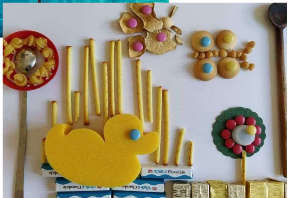
Obrázek z domácích zdrojů