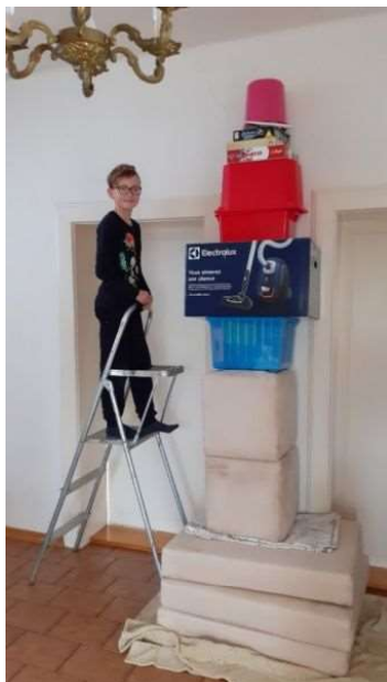
Moje věž je nejvyšší