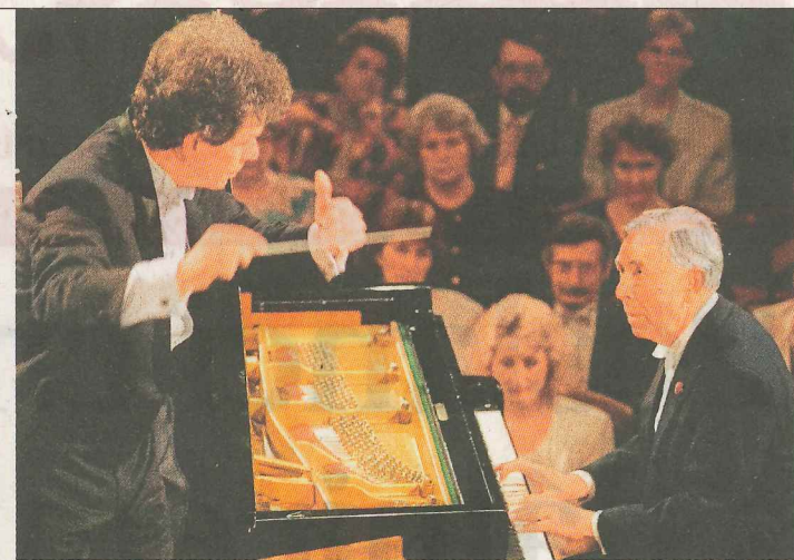
Mistr s mistry Horní snímek zachycuje Rudolfa Firkušného na koncertě Pražského jara pod vedením dirigenta Jiřího Bělohlávka (květen 1992), dole je se svým přítelem Rafaelem Kubelíkem (říjen 1991).