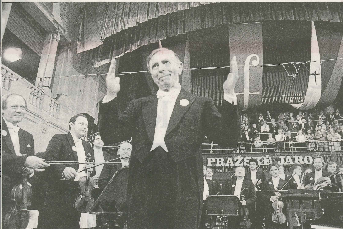
Rudolf Firkušný Napajedelský rodák se do vlasti vrátil po více než 40 letech. S Českou filharmonií vystoupil už 28. května 1990 ve Smetanově síni Obecního domu v Praze. Byly to pro něj velmi emotivní okamžiky. O rok později zahrál také ve svém rodném městě.