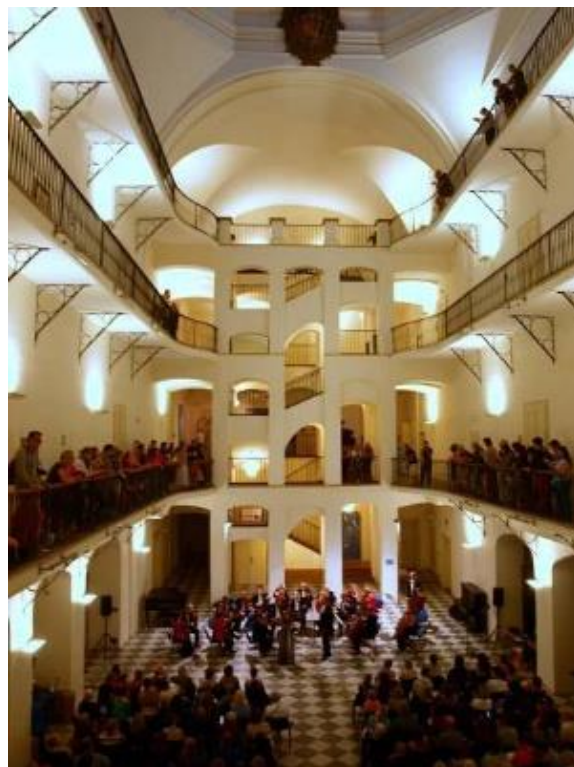
České muzeum hudby v Praze

Akce se bude konat v červnu 2017, o podrobnostech budete včas informováni.