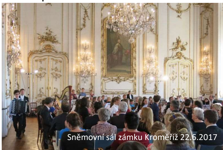
Sněmovní sál zámku Kroměříž 22.6.2017