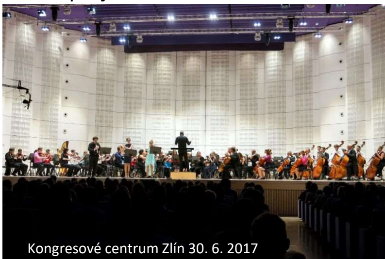
Kongresové centrum Zlín 30. 6. 2017