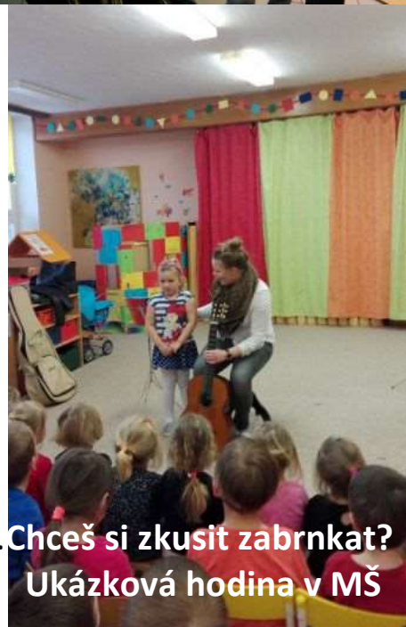
Tohle je kytara. Chceš si zkusit zabrnkat? Ukázková hodina v MŠ