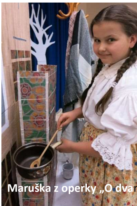
Maruška z operky „O dvanácti měsíčkách“ v nastudování pěv. sboru „HeXaM“