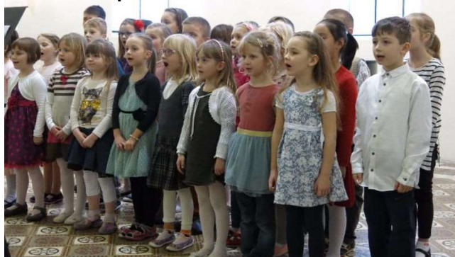
Pěvecký sbor „Zpěváček“