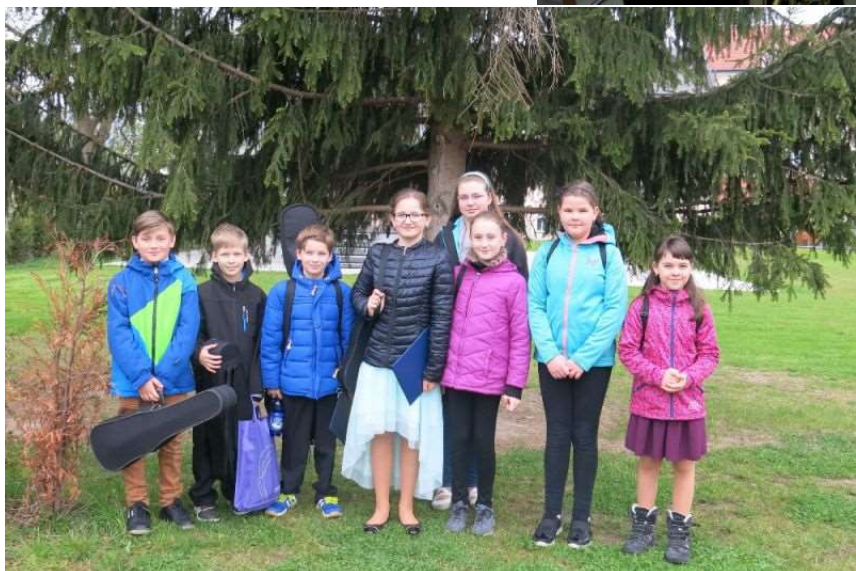
Jdeme zahrát dětem do MŠ