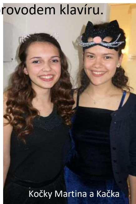
Kočky Martina a Kačka