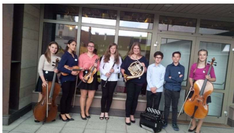
Malí filharmonici před Kulturním domem v Uherském Brodě 23. 6. 2017

náhradníků. Zato violisti, bicisti nebo lesní roh z řad dětí byli velmi