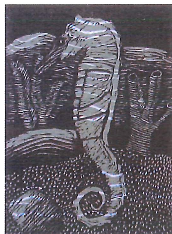
„Mořský koník“ (technika tisku z výšky - linoryt, soutisk dvou barev).