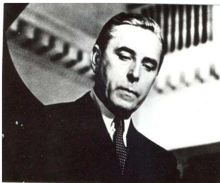
Rudolf Firkušný (1912 Napajedla – 1994 Staatsburg)

Od roku 2001 probíhá pravidelně koncert Setkání s hudbou – Pocta Mistru Rudolfo Firkušnému jako každoroční vzpomínka na tohoto pianistu a současně jako dárek k jeho narozeninám.