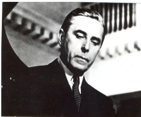
Rudolf Firkušný (1912 Napajedla – 1994 Staatsburg)

V roce 2014 proběhl již 14. ročník koncertů Setkání s hudbou – Pocta Mistru Rudolfu Firkušnému jako každoroční vzpomínka na tohoto pianistu a současně jako dárek k jeho narozeninám.