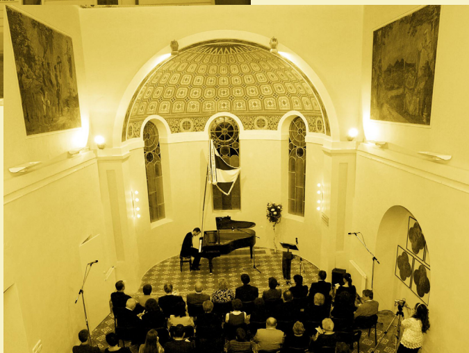
Koncertní síň Rudolfa Firkušného