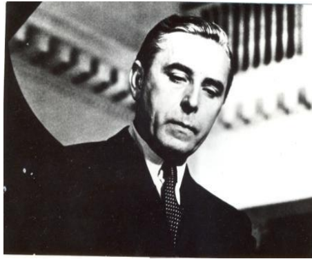
Rudolf Firkušný (1912 Napajedla – 1994 Staatsburg)

V roce 2012 proběhl již 12. ročník koncertů Setkání s hudbou – Pocta Mistru Rudolfu Firkušnému jako každoroční vzpomínka na tohoto pianistu a současně jako dárek k jeho narozeninám.